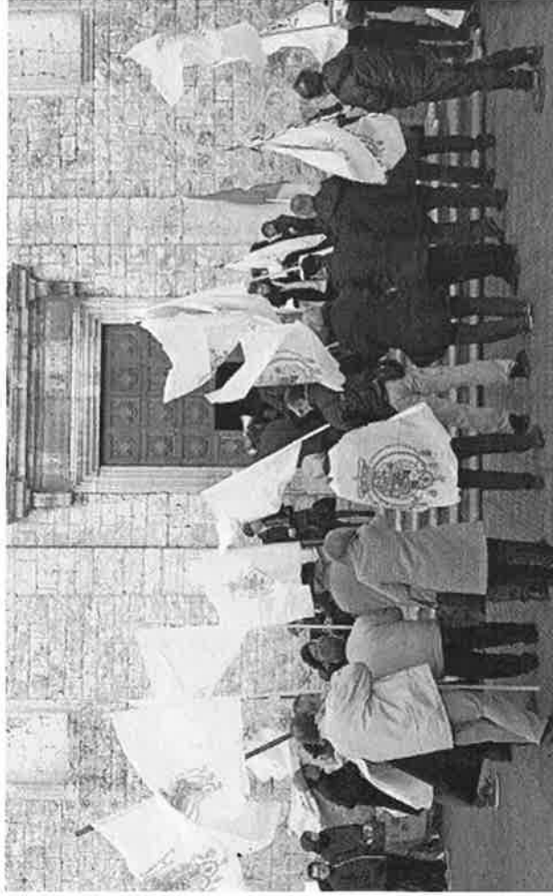
L'ultima cerimonia per la benedizione delle bandiere del Sud si è tenuta l'anno scorso a Conversano