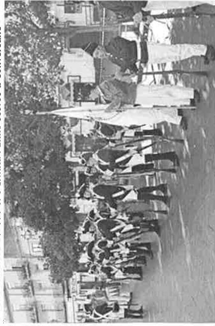
Presenzierà una rappresentanza in abiti d'epoca del Battaglione Lucania